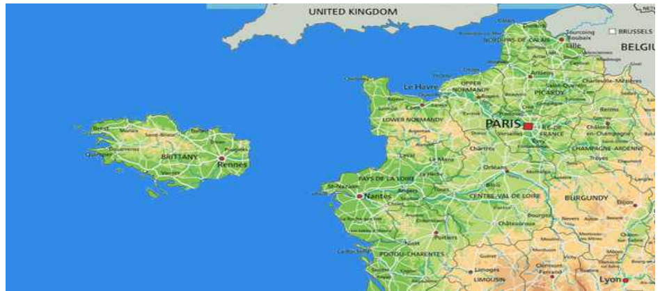
La nouvelle carte de France, Image Amélie et Gwenn,3F

Ce dimanche 1er avril, un tremblement de terre à décroché la Bretagne du reste de la France. Le nouveau bras de mer n'a pas encore été baptisé. Un habitant qui a vu la route se couper en deux témoigne : Depuis le temps qu'on en parlait, nos souhaits ont enfin été entendus. Aujourd'hui notre liberté et notre indépendance vont renaître. Une réunion d'état, suite à cet événement inattendu, devrait traiter de la question de la monnaie et de la devise bretonnes qui devraient changer.