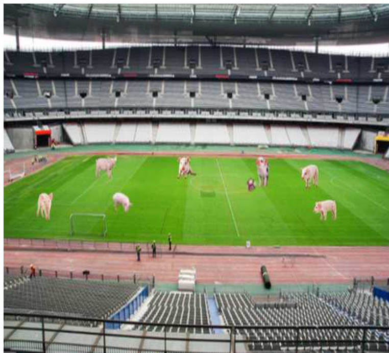
Des porcs font du sport ! Image Elisa et Florine, 3F