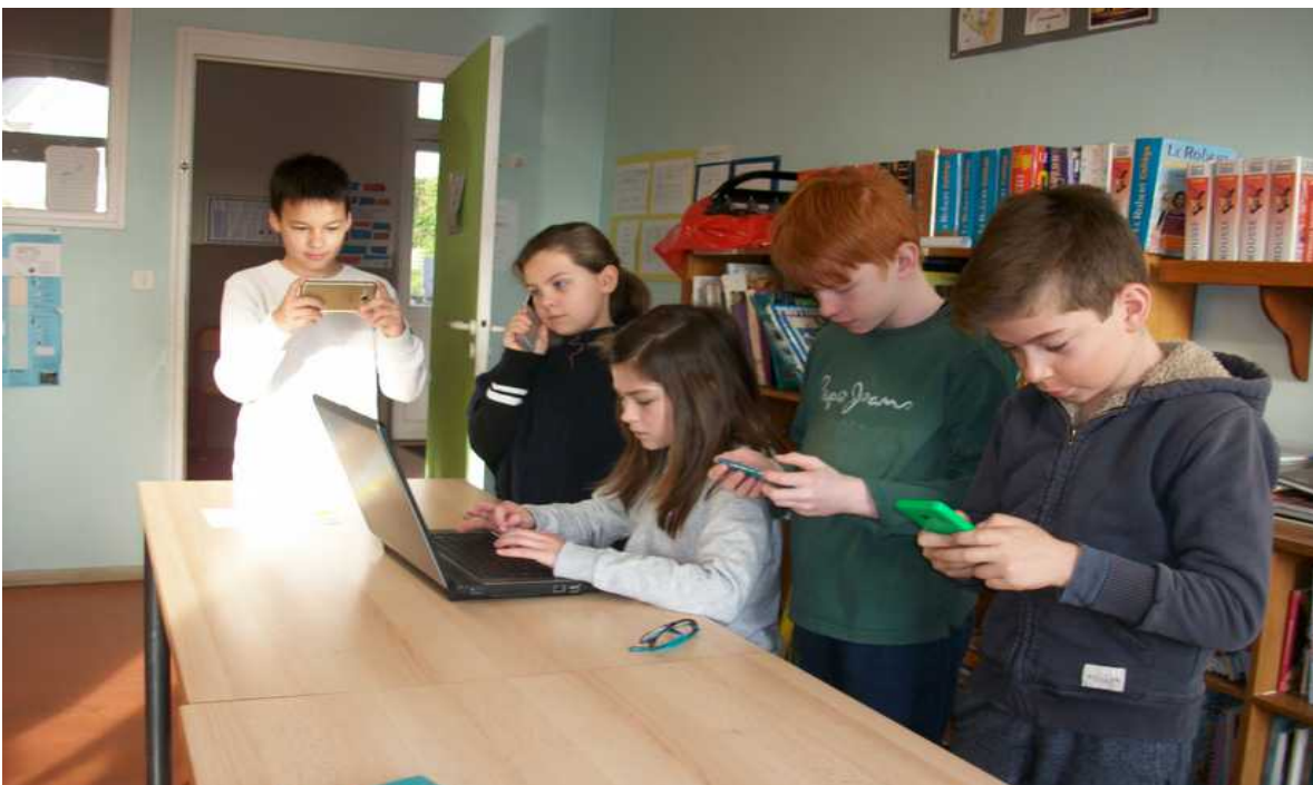
Comment communiquer ensemble si chacun reste sur son écran ? Photo classe de CM2