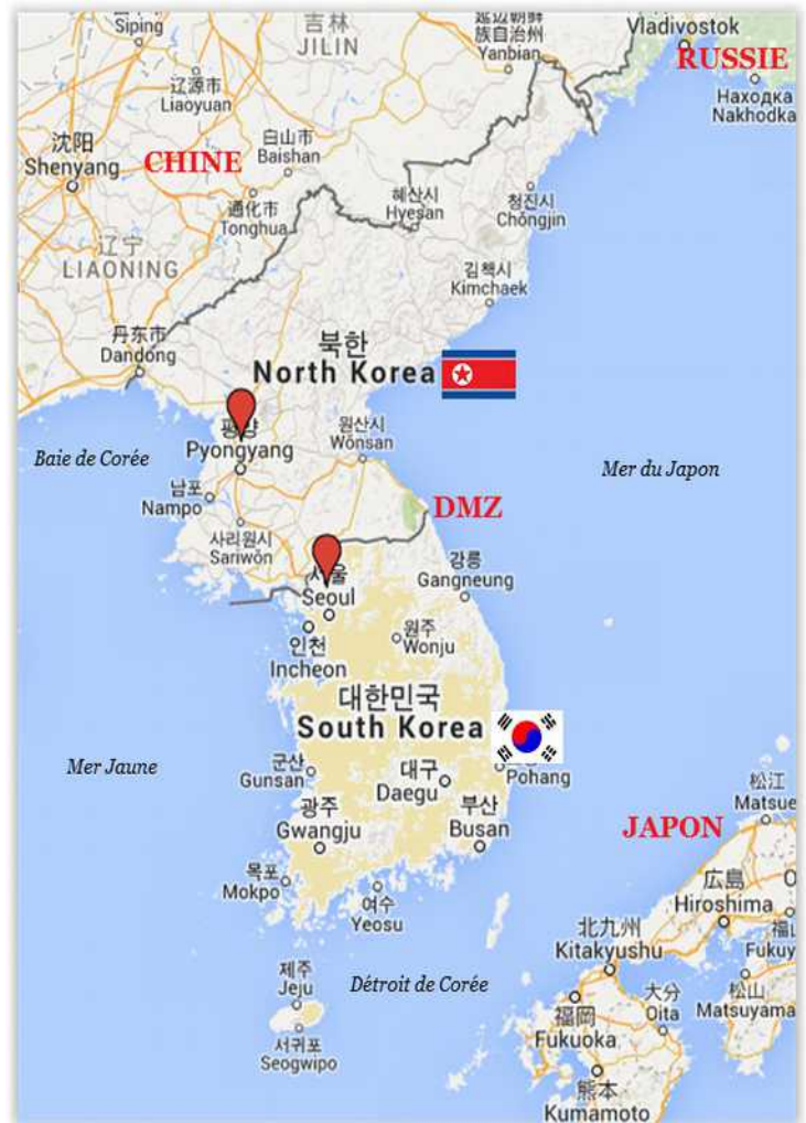
Carte de la Corée, nord et sud. Image libre de droit

La prochaine édition se déroulera en 2022 à Pékin (Chine).