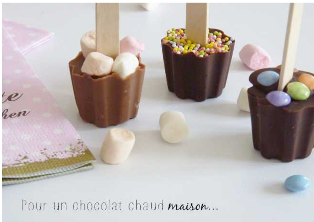
Idées de sucettes au chocolat

Démoulez les sucettes et empaquetez-les dans des petits sachets transparents.