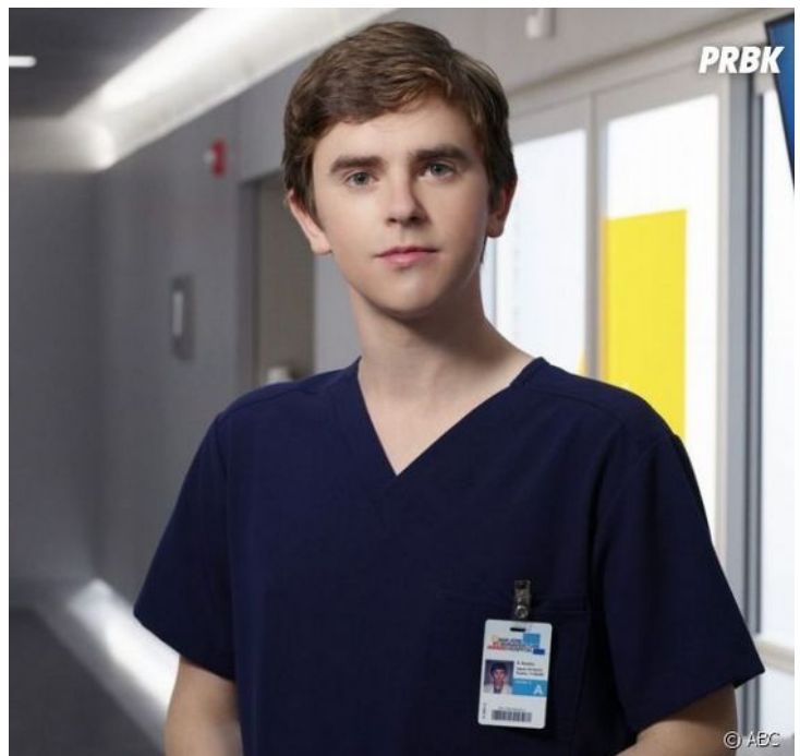
Freddie Highmore

FH: [...] Sur le tournage , nous avons des consultants. Leurs conseils et mes recherches personnelles m'ont permis de construire mon personnage afin qu'il soit le plus authentique possible [...].