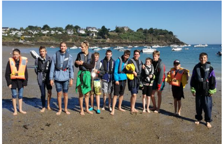
Le groupe Passerelle va observer les dauphins à Cancale

On vient au collège pour travailler dans toutes les matières avec un enseignant spécialisé et un éducateur. En ce moment nous participons à un concours de Bande Dessinée. Nous travaillons ainsi dans les mêmes conditions que les adolescents de notre âge. Nous avons aussi des temps d'inclusion de jeunes dans certaines matières dans des classes du collège. Nous allons des fois au CDI pour emprunter des livres et rédiger un article sur le livre qu'on a lu.