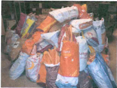
Récolte du pain

L'argent récolté est utilisé pour la construction de puits, aide aux écoles et collèges, installations de jardins maraîchers ... au Mali.