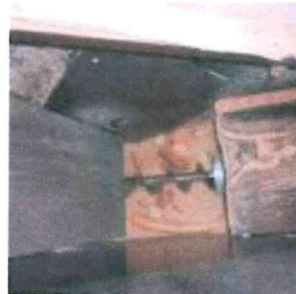
Broyage du pain