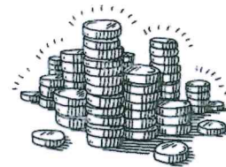
Construction de puits ...

L'eau du puits est utilisé pour l'agriculture