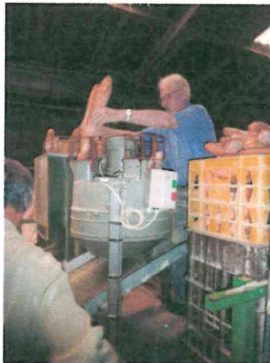
Tranchage du pain