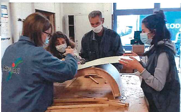
Réalisation d'un prototype