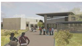
« Le Bocage/Dinard »