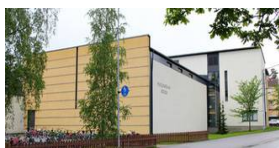
« Hyvinkää Koulu »