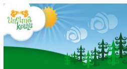
« Kauiainen Koulu »

entre le Collège le Bocage de Dinard , France & Puolimatkan Koulu, Hyvinkää, et Kasavuori Koulu, Kauniainen, Finlande